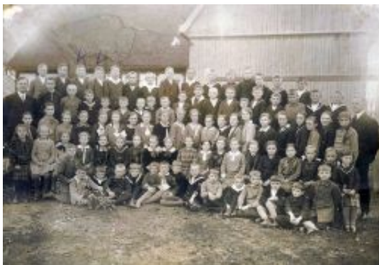
Schüler der Schule in Horst ca. 1930