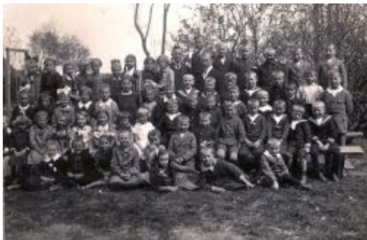
Schüler der Schule in Horst ca. 1925