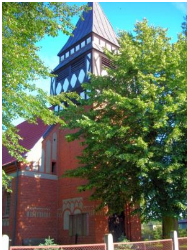
Kirche in Luggewiese