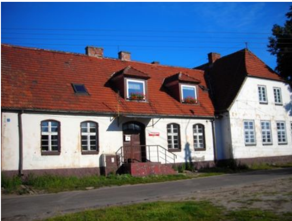
Schule in Luggewiese

Eine Schule in Luggewiese gab es seit 1785, zunächst im Wohnhaus des Dorfhirten.