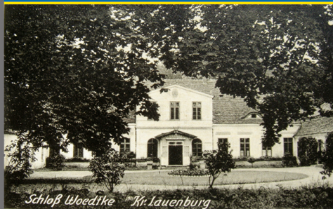
Schloß Woedtke Kr. Lauenburg

Ein Beitrag zur Regionalgeschichte Pommerns im heutigen Polen