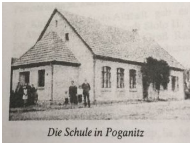
Die Schule von Poganitz