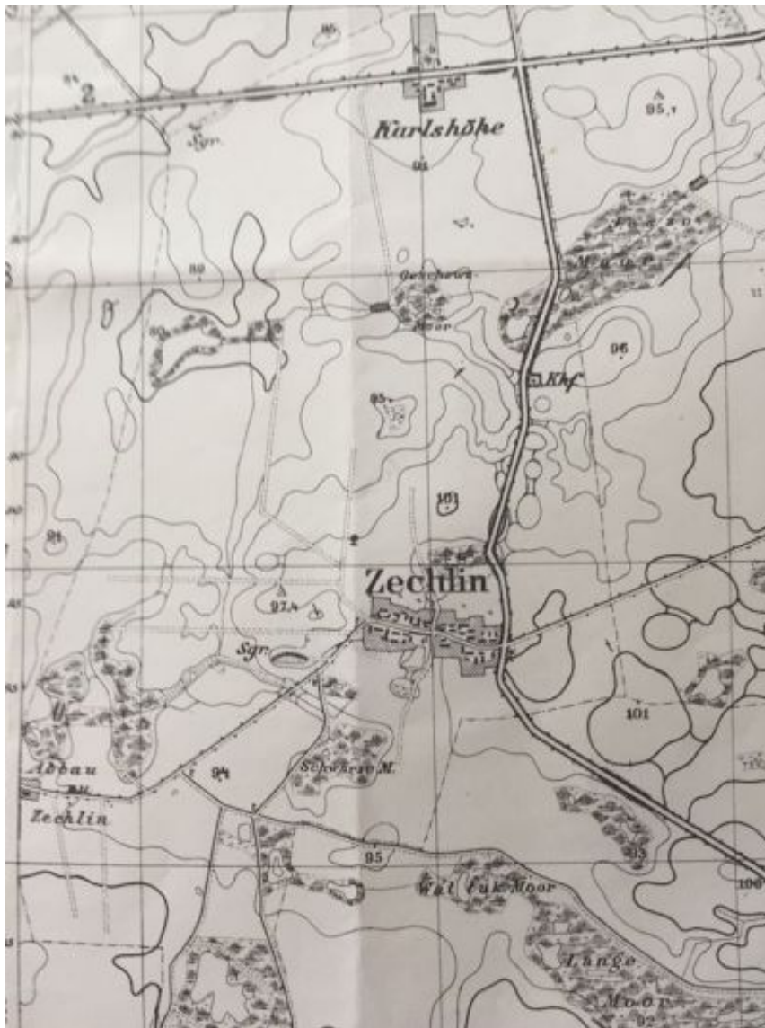
Kartenausschnitt aus der

Genealogischen Karte POM-OST, KÖSLIN v. Fritz Schulz, 2011