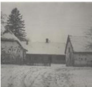
7a - Alte Schule