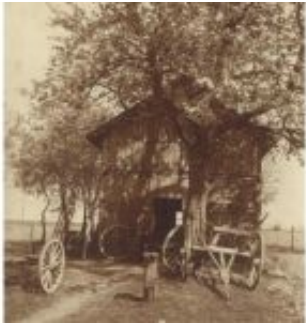
29 - Alte Schmiede