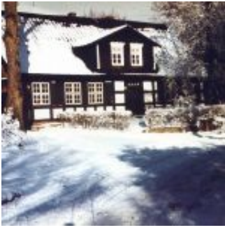
Hof H. Stiewe