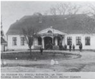
1 - Gutshaus