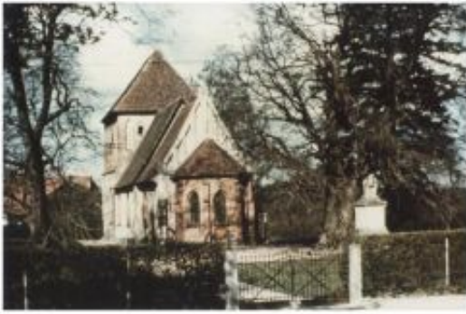
_ Kirche mit Kriegerdenkmal