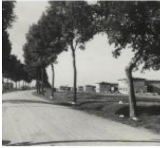
30-48 - Aufsiedlung